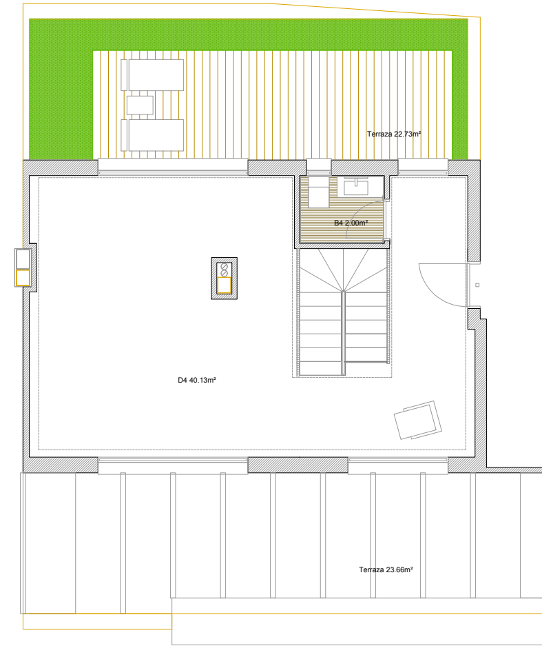
ALTERNATIVA VIVIENDA BAJO CUBIERTA